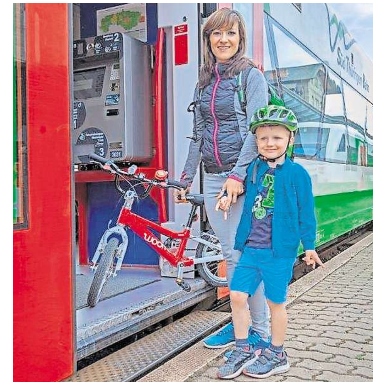
Ferienkinder und auch Teenager kommen mit dem Schülerferienticket preiswert durch den Sommer.

Der Clou für Sparfüchse: Zusätzlich gibt es beim Vorzeigen der Ti-