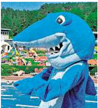
Das Maskottchen des 24-Stunden-Schwimmens: „Haino“.

Immer wenn „Haino“, das Hai-fischmaskottchen des Meininger Schwimmklassikers von den Plakaten grüßt oder im Stadtbild unterwegs ist, dann ist es wieder soweit. Am Samstag startet um 12 Uhr die 20. Auflage dieser beliebten Breitensportveranstaltung mit einem bunten Rahmenprogramm aus Musik, Akrobatik, Sport und anderen illustren Einlagen. Den Auftakt macht in diesem Jahr der Wasunger Fanfanzenzug und es folgen unter anderem ein Cheerleader-Feuerwerk sowie Kunststradsporler aus Holzthaleben. Da kommt keine Langeweile auf, auch wenn sich die Besucher nicht am schwimmischen Wettbewerb beteiligen möchten. Ohnehin braucht jeder nur so lange oder so oft ins Wasser gehen, wie er dazu Lust und Laune verspürt. Allerdings möchten die Meininger Wasserfreunde ihren Gästen und der Stadt in diesem Jahr noch einen besonderen Leckerbissen bieten. Es geht um einen Eintrag ins Guinness-Buch der Rekorde. Eigentlich könnte das